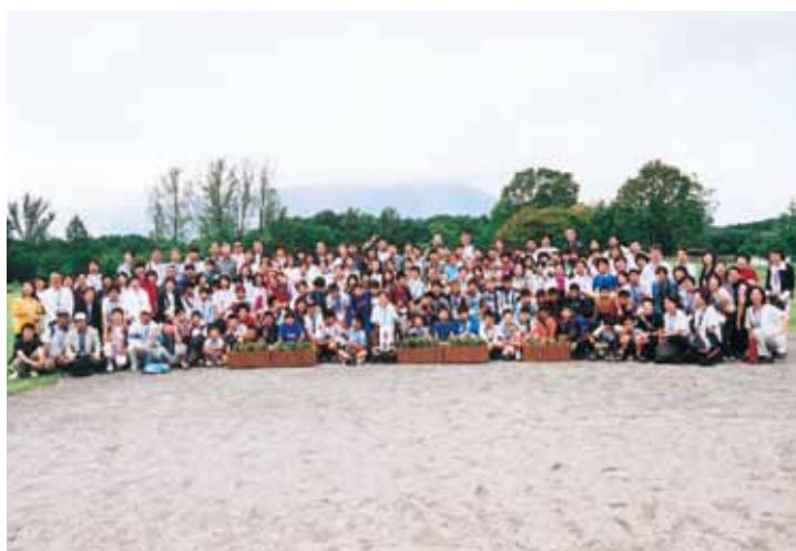
2004年 东京 · 岩手