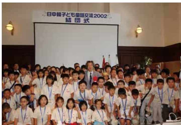
2002年 东京 · 兵庫 · 大阪 · 奈良