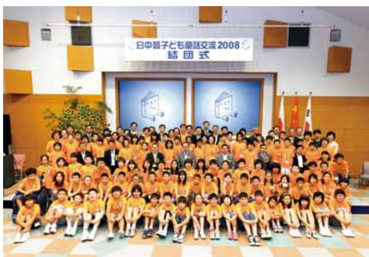
2008年 东京 · 熊本