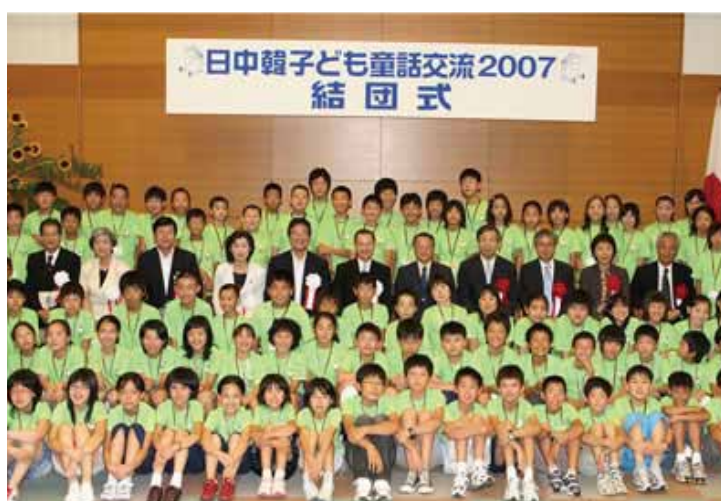
2007年 东京 · 长野