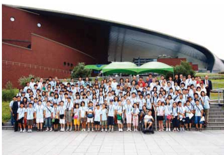
2006年 东京 · 山口