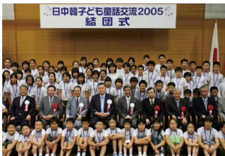
2005年 东京 · 静岡